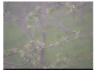
Frelighsburg, 9 mai